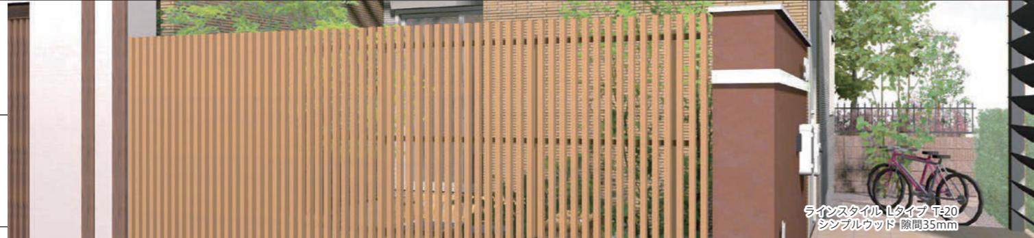
ラインスタイル Lタイプ T=20 シンプルウッド 隙間35mm