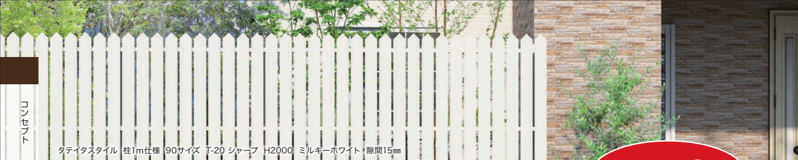
タテイタスタイル 柱1m仕様 90サイズ T-20 シャープ H2000 ミルキーホワイト 隙間15mm