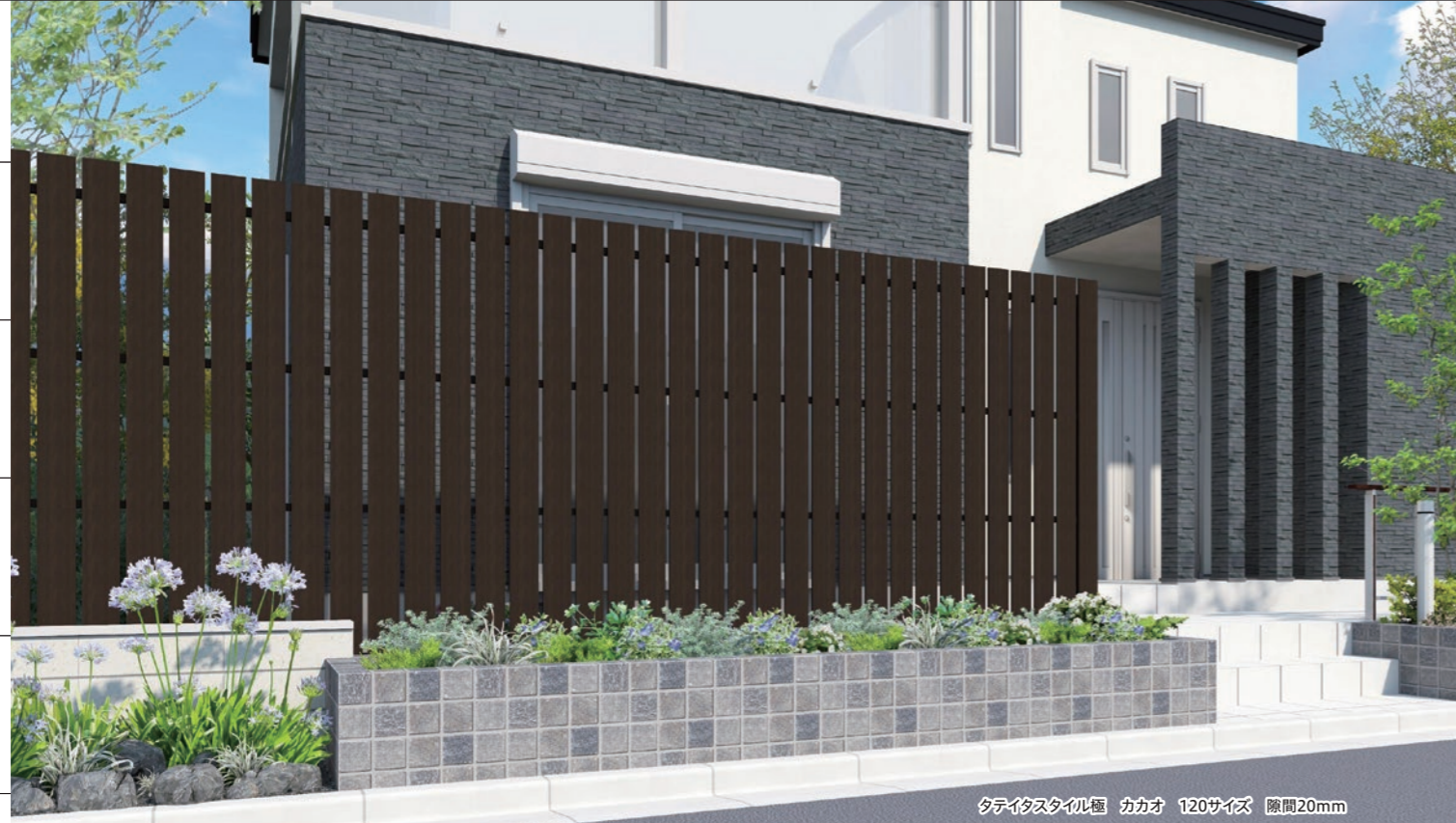
タテイタスタイル極 カカオ 120サイズ 隙間20mm