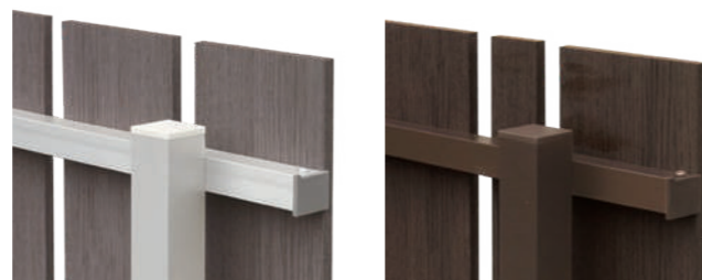
120サイズ (隙間20mm) 横棧 端部キャップ 120+45サイズ (隙間20mm) 横棧 端部キャップ

板ピッチは5mm単位で自由に変更できます。(最小隙間10mm) 別途ご相談ください。